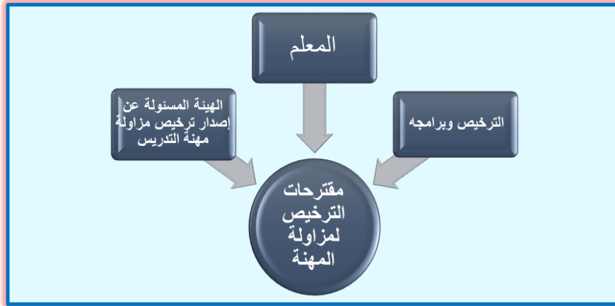
شكل 3: محاور مقترحات تطبيق الترخيص لمزاولة مهنة التدريس

أولاً: المقترحات الخاصة بالهيئة المسؤولة عن إصدار ترخيص مزاول مهنة التدريس