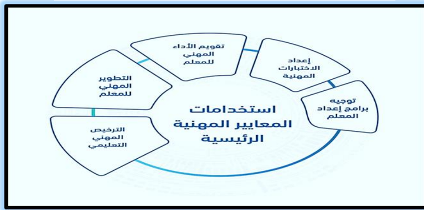
شكل 1 استخدامات المعايير المهنية السعودية

تعد المعايير المهنية الركيزة الأساسية لمتطلبات الرخصة المهنية التربوية، وهي تُغطي كافة مراحل مهنة المعلم ، و تشتق منها السياسات والمؤشرات والإرشادات الخاصة والأدلة لكل استخدام منها: توجيه البرامج التدريبية لإعداد المعلم وتأهيله، توظيف واختيار المعلمين المستجدين، وإعداد الاختبارات التخصصية والمهنية العامة ، وتقويم وتطوير الأداء المهني المستمر ، تطوير أدوات و نماذج قياس الأداء ، كما تدعم عمليات تقويم أداء المدرسة من أجل تطويرها لتكون منظومة متكاملة بجميع مدخلاتها البشرية و المادية وخاصة المعلمين. وهي بذلك تتكامل مع عملية تطوير البرامج والمقررات الدراسية فتتفاعل معها ، وتسهم معها في تحقيق الأهداف المرجوة والمرسومة لها. يوضح شكل 1 أهم استخدامات المعايير المهنية.